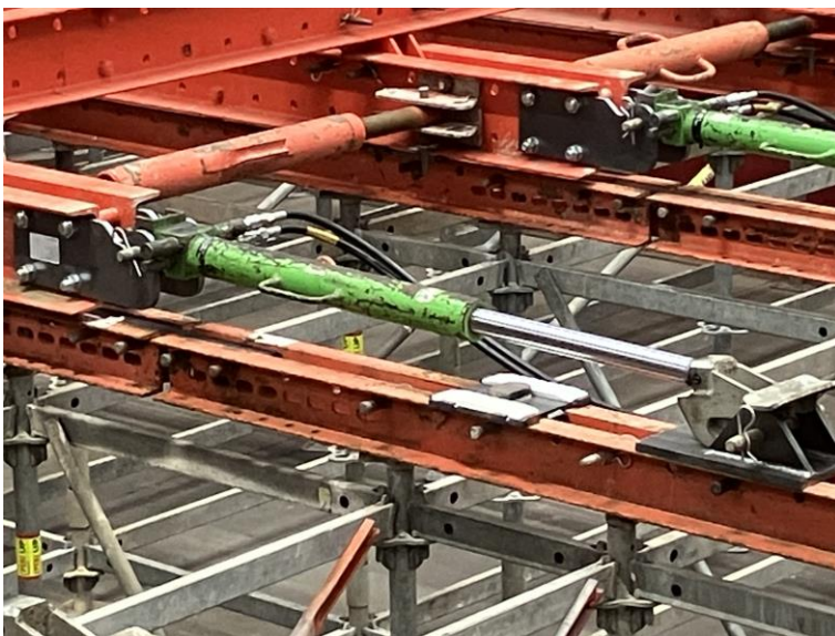
Foto 13 Verplaatsen van het platform gebeurt met een hydraulisch systeem

Verplaatsen van het platform gebeurt met een hydraulisch systeem (foto 13). Aan één zijde van het platform bevinden zich vier cilinders die het platform naar voren duwen. De cilinders zetten zich af op schoenen die in de gordingen zijn vastgeklemd. Bij een nieuwe slag worden de cilinder ingetrokken en worden de schoenen verplaatst. Op de gordingen bevinden zich teflonplaten om het glijden van het platform te vereenvoudigen (foto 14).