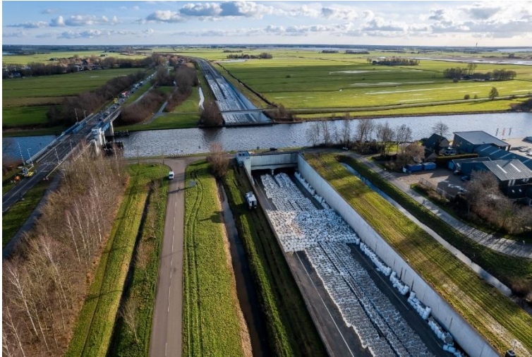
Foto 3 Big bags zorgen ervoor dat tunnelmoot weer in positie komt

Om de tunnel weer open te kunnen stellen is een deel van de ballast vervangen. Daarbij moest het neerwaartse gewicht gehandhaafd blijven. Om dat te bewerkstelligen zijn big bags bij de betreffende moot vervangen door staalplaten, waardoor ruimte ontstond voor de rijstroken. Aan de zijkanten zijn betonblokken geplaatst (foto 4). Ruim een maand nadat met de noodmaatregelen was begonnen, konden twee rijstroken worden geopend, één in elke richting.