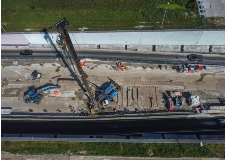
Foto 9 Relatief groter stelling om ankers in een keer aan te kunnen brengen

Voor het boren van de ankerpalen wordt een relatief grote stelling gebruikt om de palen van 30 m in één keer aan te kunnen brengen (foto 9). Normaal worden ankers van deze lengte gekoppeld en is een kleinere stelling mogelijk. Koppelen was in dit geval echter niet mogelijk om de sluisconstructie continu waterdicht te houden.