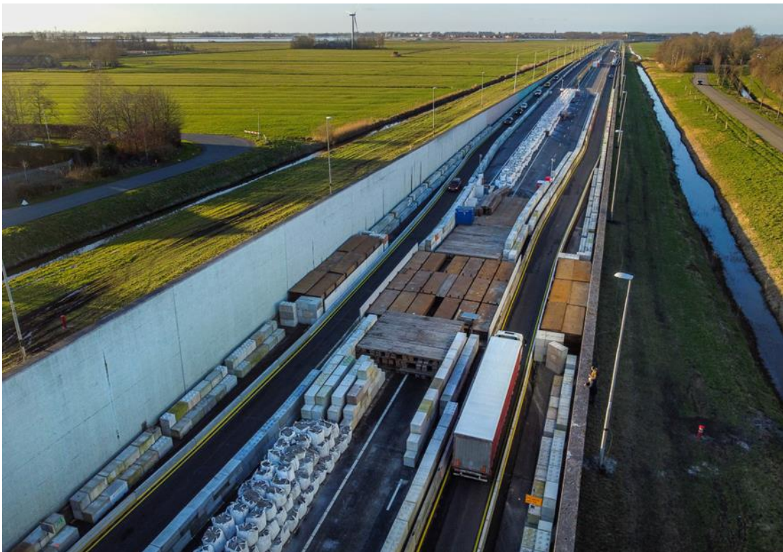
Foto 4 Ter plaatse van tunnelmoot zijn big bags vervangen door staalplaten

Om de tunnel weer open te kunnen stellen is een deel van de ballast vervangen. Daarbij moest het neerwaartse gewicht gehandhaafd blijven. Om dat te bewerkstelligen zijn big bags bij de betreffende moot vervangen door staalplaten, waardoor ruimte ontstond voor de rijstroken. Aan de zijkanten zijn betonblokken geplaatst (foto 4). Ruim een maand nadat met de noodmaatregelen was begonnen, konden twee rijstroken worden geopend, één in elke richting.