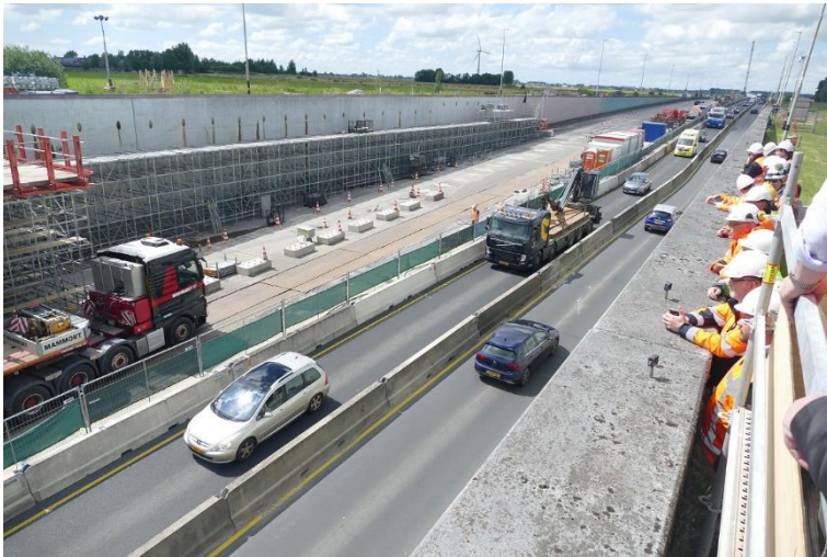
Foto 2 Stubeco-leden bekijken de herstelwerkzaamheden bovenaf; links een deel van de ondersteuningssteiger en het werkplatform en ernaast de voorbouwsteiger

De Prinses Margriettunnel – vanwege de lengte feitelijk een aquaduct – ligt in de snelweg A7 onder het Prinses Margrietkanaal bij Uitwellingerga in Friesland (nabij Sneek). De tunnel is gebouwd in de periode 1976-1978 door een combinatie van Dura en Voormolen. De tunnel bestaat uit 48 moten van 18 m lang 31 m breed. Inclusief toeritten is hij 938 m lang, het gesloten deel 77 m. Het diepste punt is NAP -12,2 m, ruim 11 m onder het grondwaterpeil. De tunnel is gedeeltelijk gefundeerd op trekpalen, gedeeltelijk op staal. Er zijn in totaal 1360 trekpalen voorzien (Vibro Ø450 mm), met centrale stalen Dywidag voorspanstaven (Ø32 mm en Ø 36 mm).