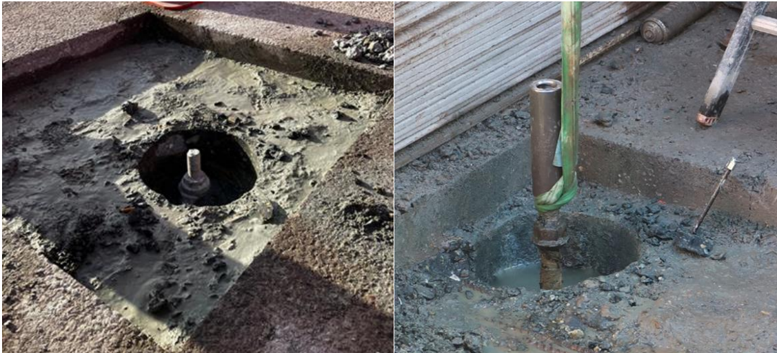
Foto 5 (links) Bij een aantal trekpalen is de vloer opgehakt

Om te onderzoeken of de trekpalen geotechnisch of constructief zijn bezweken, zijn de voorspanstaven van de palen onderzocht. Hiertoe is bij een aantal trekpalen de vloer opgehakt (foto 5), zodat de voorspanstaaf kon worden bereikt. Vervolgens is op de kop van de voorspanstaven een koppelmof geschroefd en is met een kraan aan de voorspanstaven getrokken (foto 6). Daarbij bleek dat een aantal voorspanstaven was gebroken, op verschillende niveaus. Bij een aantal niet-bezweken trekpalen is de voorspankracht in de staven gemeten.