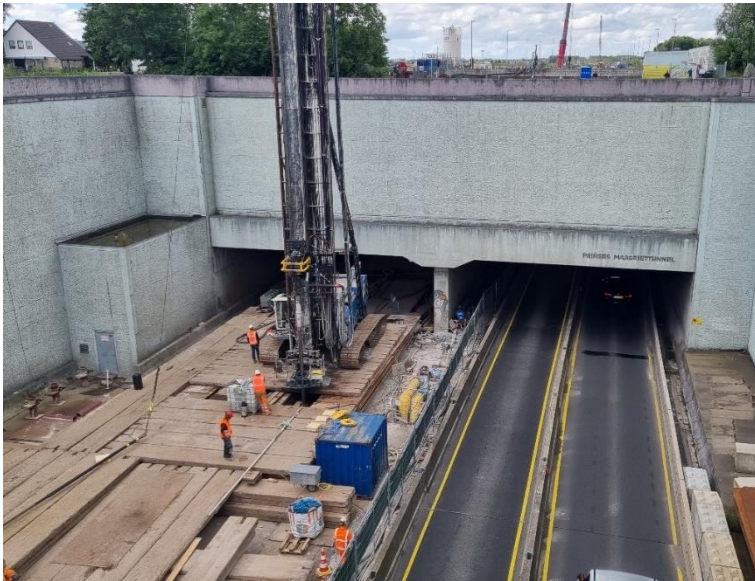
Foto 10 Aanbrengen trekankers boven waterkelder

Een uitdaging vormde de ankers ter plaatse van de waterkelders. Hier is de sluisconstructie aangebracht in de afgesloten ruimte. Omdat het dek van de waterkelder is geperforeerd, is deze onvoldoende draagkrachtig om de boorstelling te kunnen dragen. Daarom is hier een overkluizing gemaakt (foto 10).