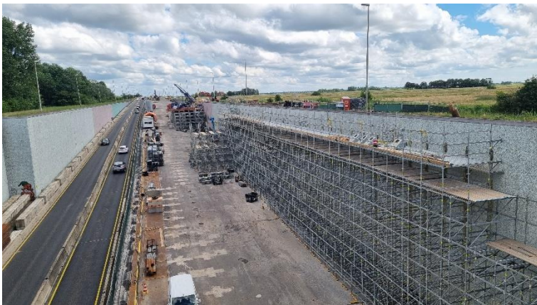
Foto 16 Voorbouwsteiger met in de verte werkplatform

Voor de voorbereiding en afwerking van de ankerboorgaten is een voorbouwsteiger benodigd (foto 1 en 16). Vanwege het hoge tempo van het boren is deze over nagenoeg de volledige lengte van de tunnel opgebouwd. Deze steiger is 2,5 m en heeft een optopping van 0,75 m breed. De boorapparatuur zelf staat op de wand.