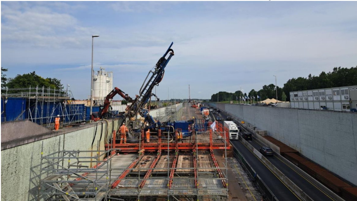
Foto 12 Ankerstelling staat op een verschuifbaar platform

Verplaatsen van het platform gebeurt met een hydraulisch systeem (foto 13). Aan één zijde van het platform bevinden zich vier cilinders die het platform naar voren duwen. De cilinders zetten zich af op schoenen die in de gordingen zijn vastgeklemd. Bij een nieuwe slag worden de cilinder ingetrokken en worden de schoenen verplaatst. Op de gordingen bevinden zich teflonplaten om het glijden van het platform te vereenvoudigen (foto 14).